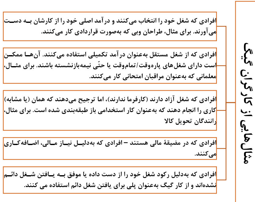
شکل ۲-۱ مثال‌هایی از کارگران مشغول در اقتصاد گیگ

در لغت‌نامه دانشگاه کمبریج، اقتصاد گیگ به این صورت تعریف شده است: یک روش اشتغال‌زایی که بر افرادی متکی است که به‌جای کار کردن برای یک کارفرما، دارای شغل‌های موقت هستند یا به‌چند کار مجزاً مشغول هستند و برای هر کار، به‌طور جداگانه دستمزد دریافت می‌کنند. اقتصاد گیگ دارای انواع بسیار متنوعی از کارکنان گیگی است. در شکل زیر نمونه‌هایی از کارکنان مشغول در حوزه اقتصاد گیگ آورده شده است.